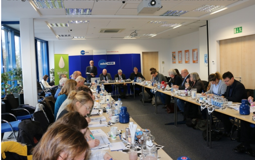
Die gut besuchte Jahrespressekonferenz der LV Milch NRW 2019

moderater. Nach Informationen des Statistischen Landesamtes hat sich die Anzahl der Milchkuhalter laut Novemberzählung um 3,7 Prozent auf 5.631 reduziert. Die Anzahl der Milchkühe ist um 1,9 Prozent auf 409.449 leicht gesunken. Die durchschnittliche Kuhzahl je Betrieb in NRW ist um 2,8 Prozent auf 73 Kühe angestiegen. Im Zeitraum Januar bis Oktober 2018 hat der Auszahlungspreis mit 32,86 Ct./kg (für konventionell erzeugte Kuhmilch mit 4,0 Prozent Fett und 3,4 Prozent Eiweiß ohne MwSt.) um 1,71 Ct./kg bzw. 4,9 Prozent unter dem Preis des Vorjahreszeitraums gelegen. Bei der Biomilcherzeugung mit durchschnittlichen 46,67 Ct./kg ging es erneut stabiler zu. In der Nische sei der Auszahlungspreis - auf höherem Niveau - um 1,2 Ct./kg also 2,5 Prozent niedriger ausgefallen.